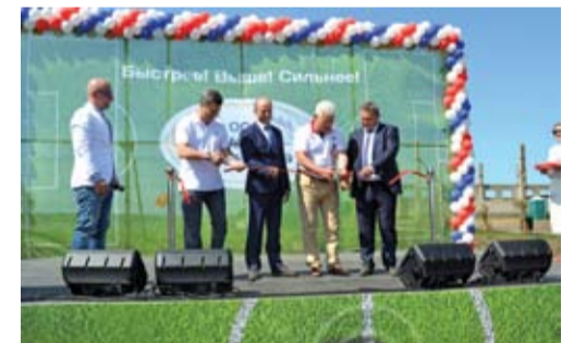
Открытие стадиона в Кульбаково.

Впервые в рамках реализации регионального проекта партии «Единая Россия» «Особое детство» состоялся фестиваль-конкурс «Семья – душа России». На конкурс представили работы 32 ребенка с ограниченными возможностями.