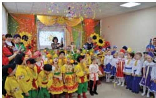
Фестиваль в детском саду.

А вот парк села Анастасиевка будет благоустроен в 2020 году. Несомненно, такие благоустроенные территории со временем появятся в каждом селе и яркое тому подтверждение – курс губернатора Ростовской области на комплексное развитие сельских территорий.