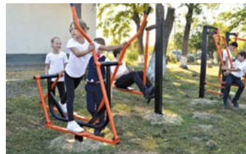
Тренажеры в Алексеевской школе.

Проведен муниципальный этап спартакиады школьников, в котором приняли участие 453 учащихся. В фестивалях Всероссийского физкультурно-спортивного комплекса «Готов к труду и обороне» приняли участие 832 человека разного возраста. Завершился чемпионат Матвеево-Курганского района по футболу, в котором приняло